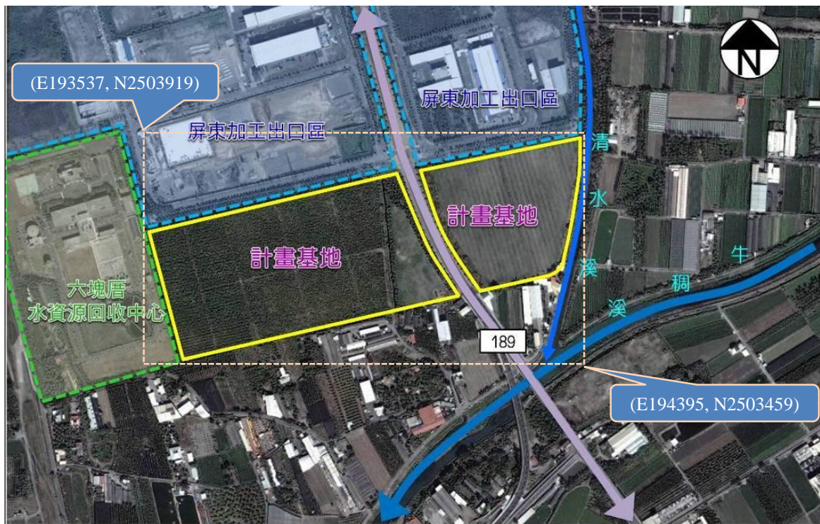
「屏東六塊厝產業園區」位置圖(二)